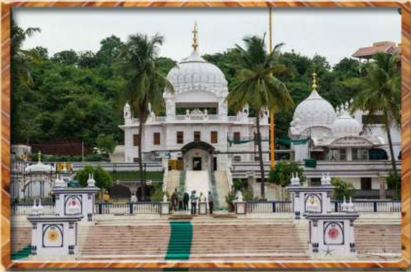
Gurdwara Nanak Jheera Sahib (Bidar)

ਜਿਥੇ ਬਾਬਾ ਪੈਰ ਧਰੈ ਪੂਜਾ ਆਸਣੁ ਥਾਪਣੁ ਸੋਆ। (ਭਾਈ ਗੁਰਦਾਸ ਜੀ, ਵਾਰ ੧, ਪਉੜੀ ੨੭)