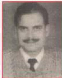
Shri Devinder Lal Sarangi